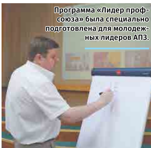
Программа «Лидер профсоюза» была специально подготовлена для молодежных лидеров АПЗ.