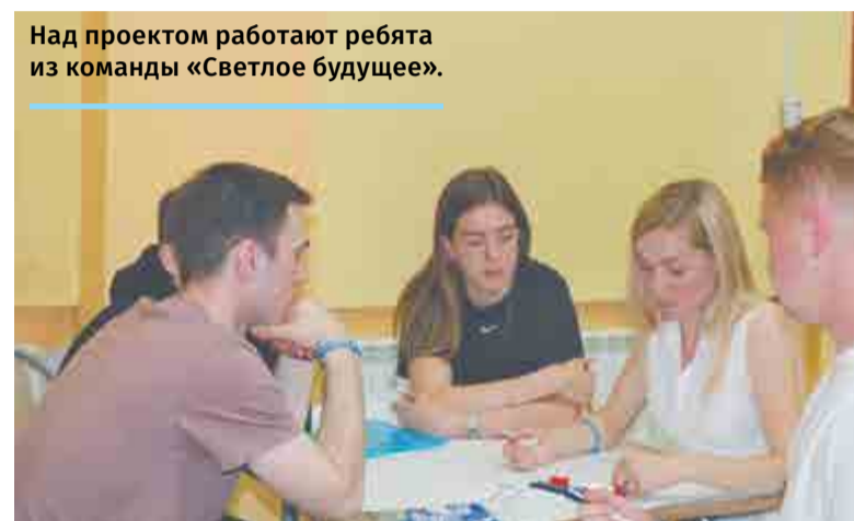
Над проектом работают ребята из команды «Светлое будущее».