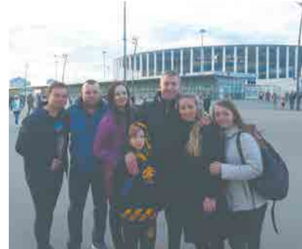
Болельщики из 49-го.