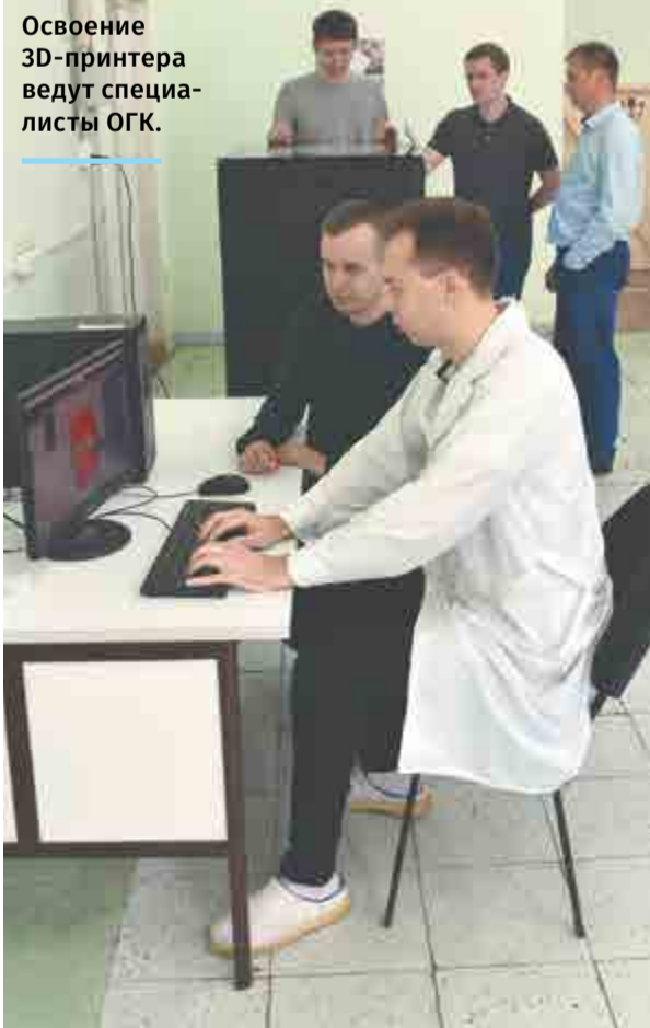
Освоение 3D-принтера ведут специалисты ОГК.

Ирина БАЛАГУРОВА