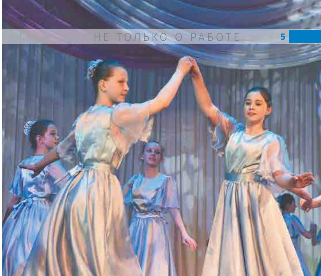
Танец «Весенний вальс».

Видеосюжет смотрите в группе АПЗ www.vk.com/oapz