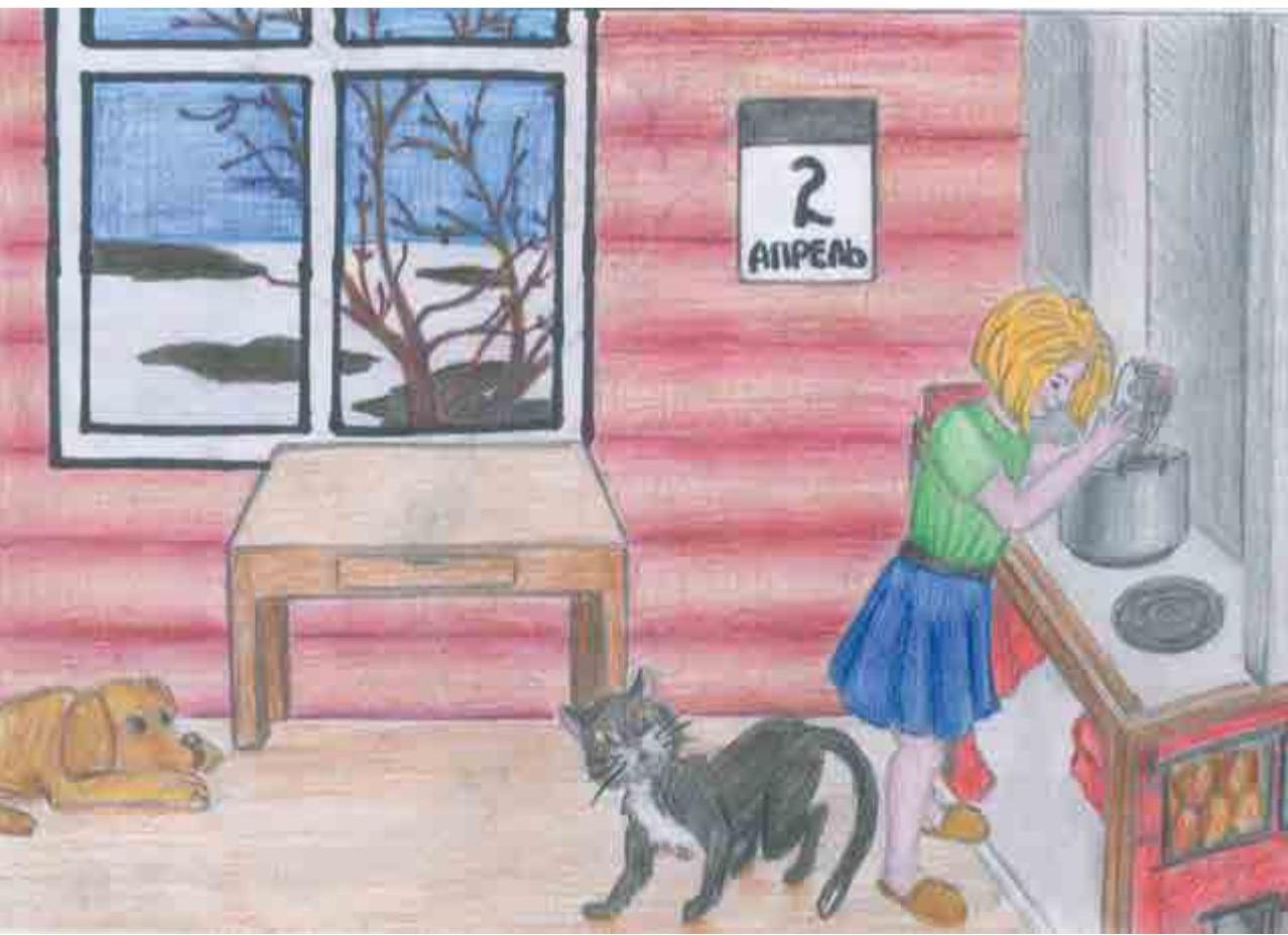
Рисунок контролера ИПИСИ службы метрологии Марии МАРКОВОЙ.