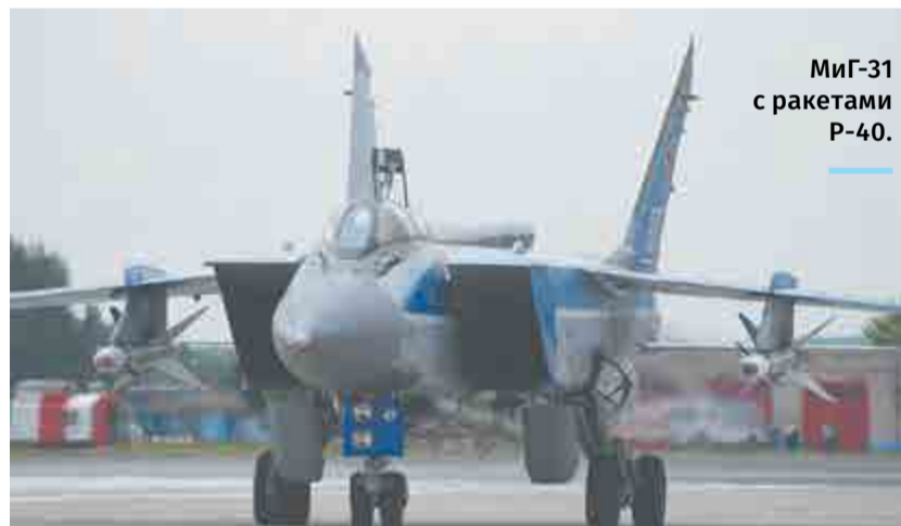
МиГ-31 с ракетами Р-40.

С новым ракетным вооружением обеспечивалось поражение воздушных целей, летящих со скоростью до 3000 км/ч на высотах от 0,5 до 27 км, в том числе выполняющих маневр с перегрузкой до 2,5 единицы. При стрельбе в заднюю полусферу дальность пуска составляла от 2,3 до 15 км, при атаке в переднюю полусферу - 30 км. Ракетное