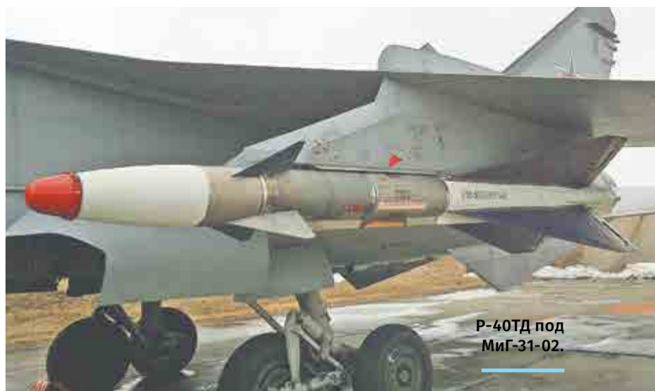
Р-40ТД под МиГ-31-02.

В сентябре 1976 года летчик Виктор Беленко перелетел МиГ-25П в Японию и попросил политического убежища в США. Радио-