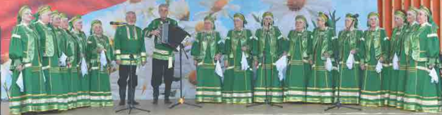
Хор ветеранов АПЗ «Легенда».