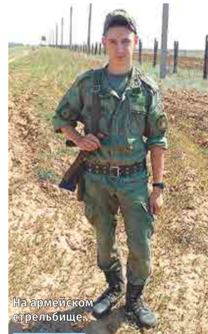
На армейском стрельбище.

На участке были рады его возвращению, говорили, что возмужал, поправился. Григорий признался: поначалу были мысли пойти в контрактники. А сегодня очень рад, что всё сложилось по-другому, и он вернулся на завод в свой родной коллектив.