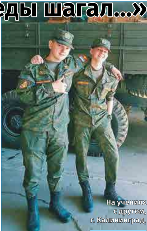
На учениях с другом, г. Калининград.

Владислав был связистом. Они в полевых условиях проводили телефонную связь до лагеря, разворачивали антенны на технике и общались