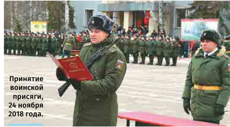
Принятие воинской присяги, 24 ноября 2018 года.

Родные гордились, что их сын, внук – «семёновец».