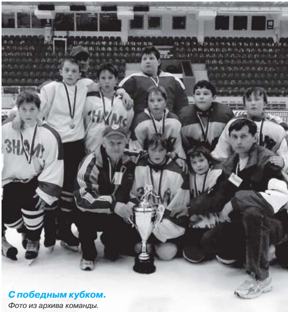
С победным кубком.