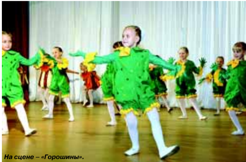
На сцене – «Горошины».