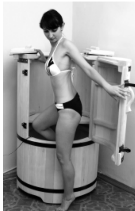
Сеанс в фитобочке – настоящая «терапия гармонии».

ритория профилактория. Разбиты новые клумбы, заасфальтирована площадка для катания на роликах и велосипедах. Интересная дизайнерская находка получила свое