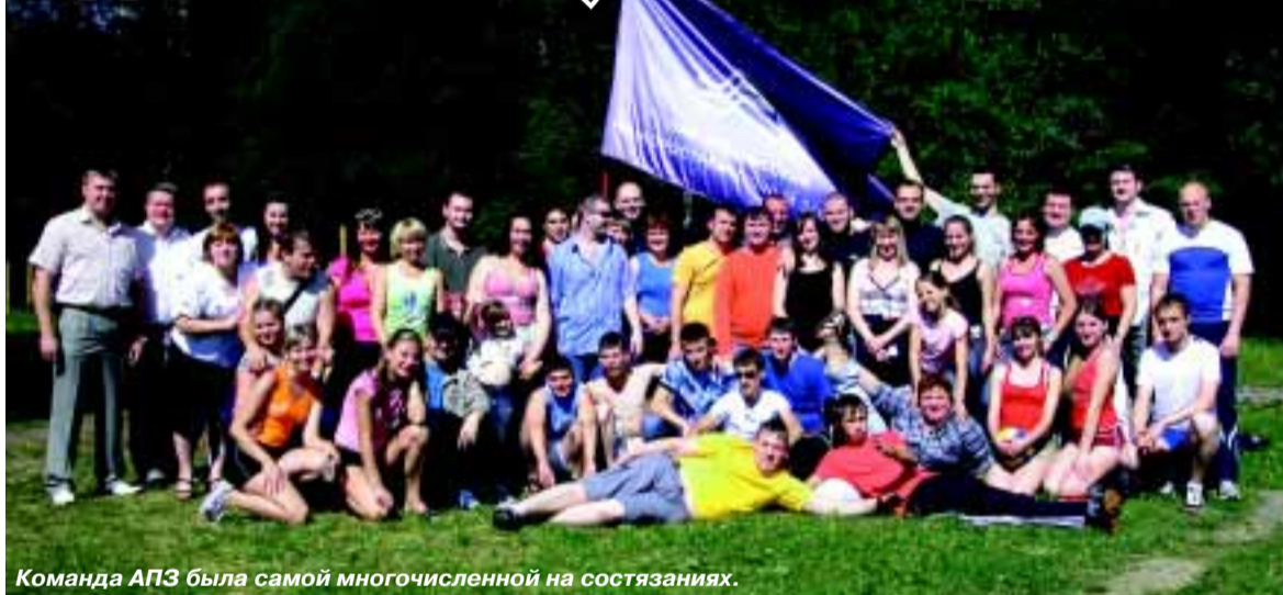
Команда АПЗ была самой многочисленной на состязаниях.

Дни здоровья на «Снежинке» рабочей молодежи предприятий города стали традиционными. 19 июня приборостроители вновь собрались на физкультурно-оздоровительной базе, чтобы пообщаться с коллегами из других предприятий города и в спортивной борьбе выявить сильнейших. Приятно отметить, что от АПЗ в этом году была самая многочисленная группа, многие пришли впервые.