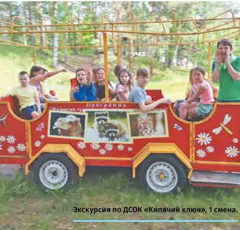
Экскурсия по ДСОК «Кипячий ключ», 1 смена.

рублей выделено из бюджета АПЗ на летнюю оздоровительную кампанию.