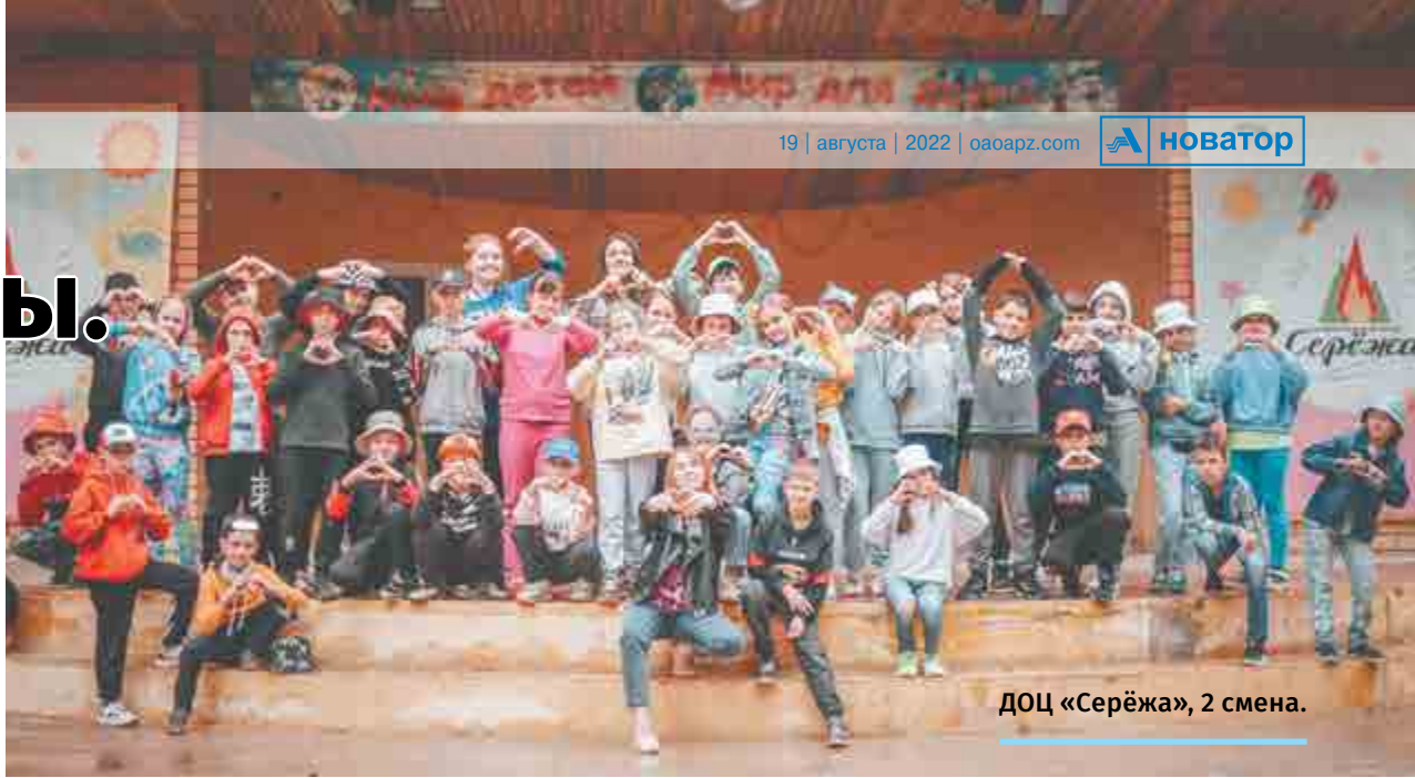
ДОЦ «Серёжа», 2 смена.