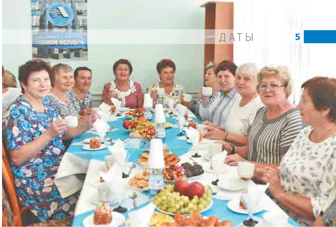
Теплый прием ветеранов ОТК.