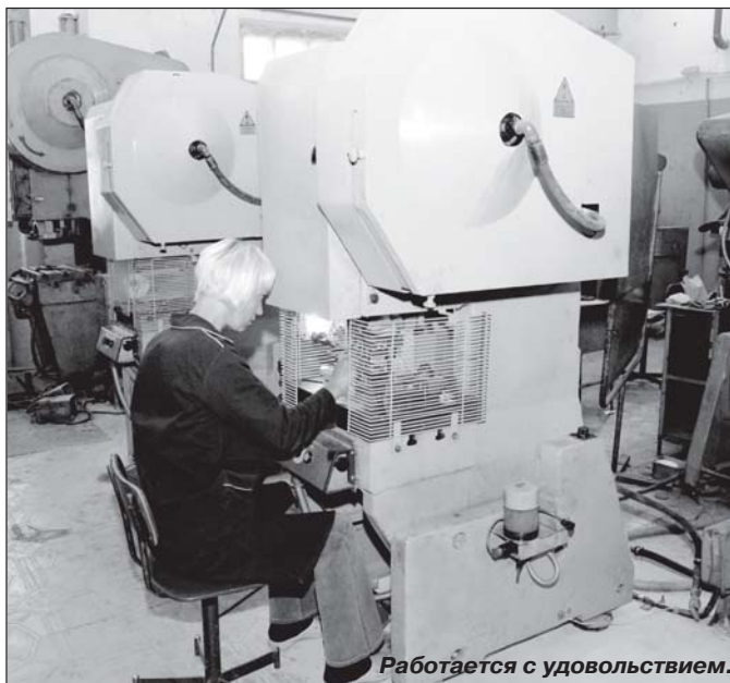
Работается с удовольствием.