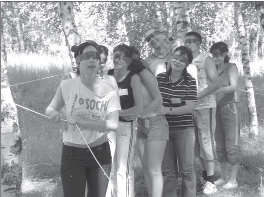
Держи меня, верёвочка, держи...