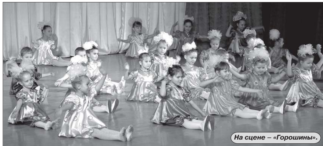
На сцене – «Горошины».

Спасибо организаторам концерта и нашим самодеятельным артистам за тёплый вечер, за подаренный