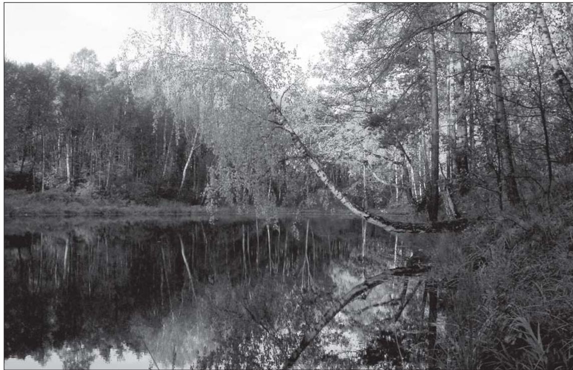
«В объятиях тишины».