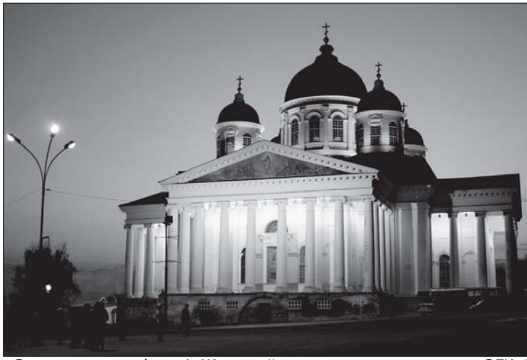
«Свет души».