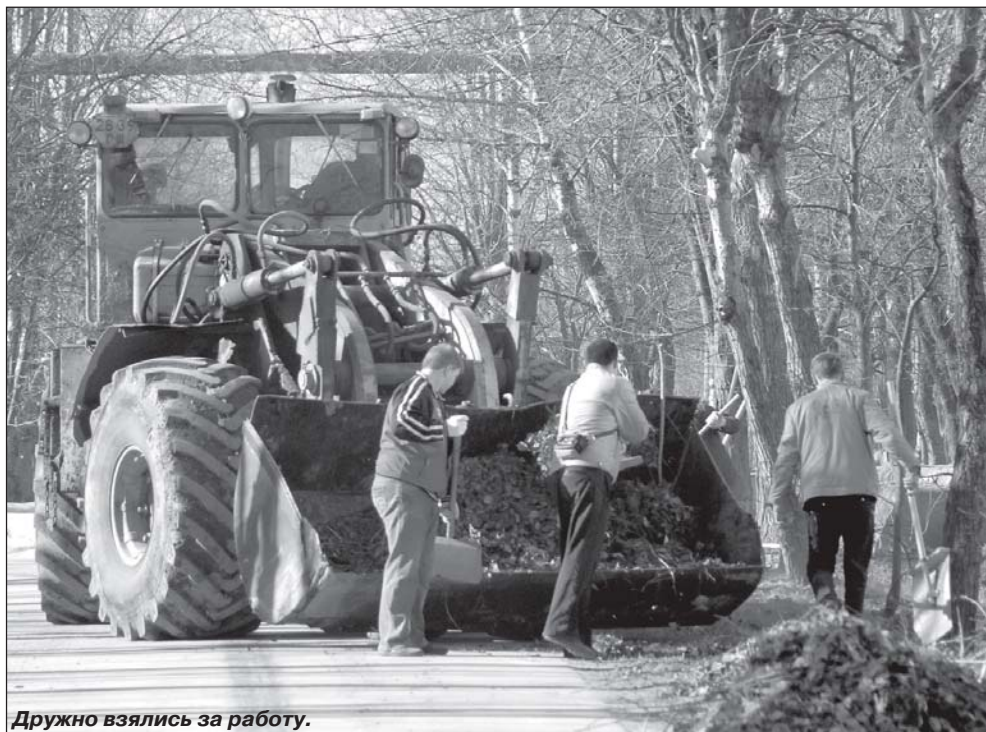
Дружно взялись за работу.