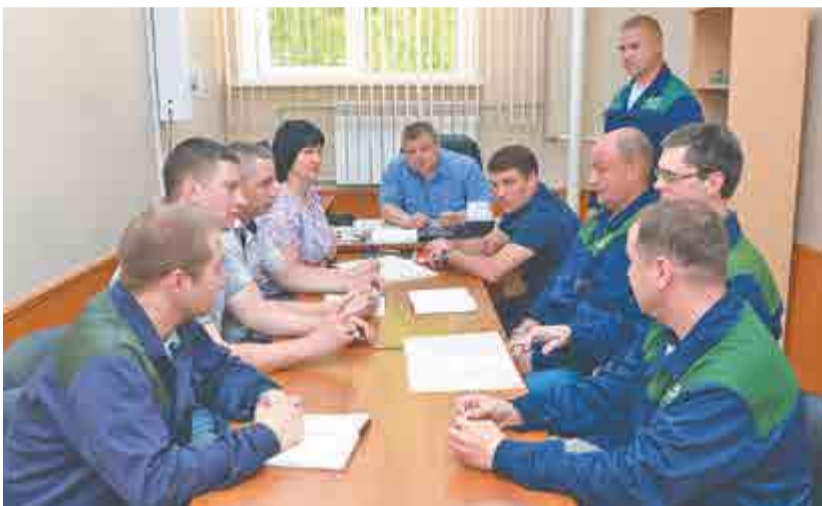
На оперативке у начальника

– Работаю на заводе с марта 1969 года. Начиная