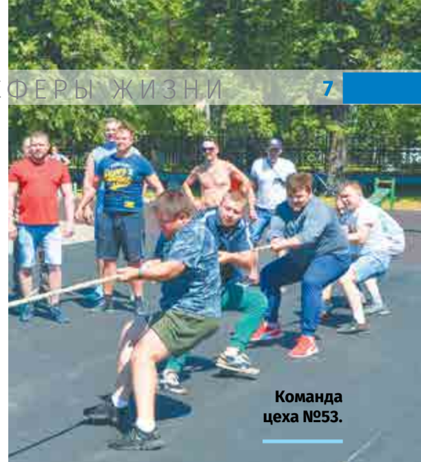
Команда цеха №53.