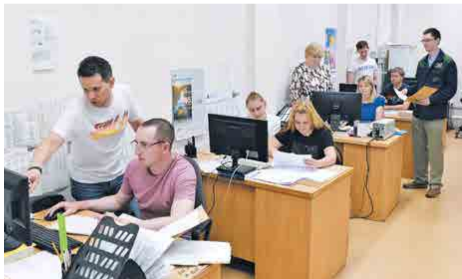
Технологи за работой

Одно неизменно: на протяжении 60 лет мы производим детали для оборонной промышленности.