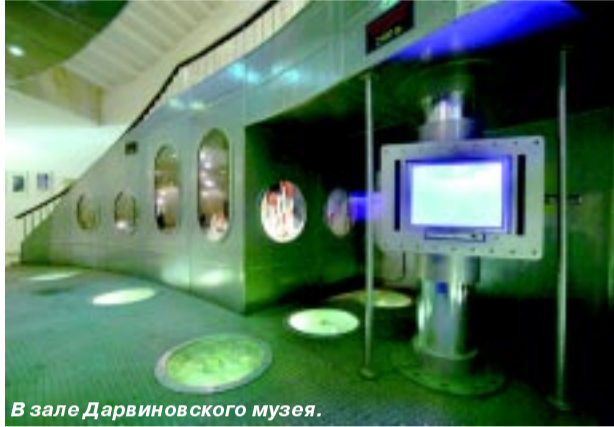
В зале Дарвиновского музея.

Не менее познавательным был и последний день: удалось побывать в Дарвиновском музее. Это современный выставочный комплекс с зонами отдыха для посетителей, компьютерным классом, прекрасно оформленными экспозициями.