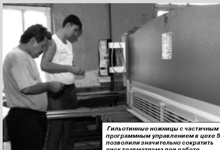
Гильотинные ножницы с частичным программным управлением в цехе 57 позволили значительно сократить риск травматизма при работе.

ся применительно к численности предприятия и количеству дней нетрудоспособности работников, находившихся на больничных листах в связи с полученными травмами. Следует отметить, что в отрасли и на предприятиях, отнесенных по виду экономической деятельности к аналогичному классу профессионального риска, средние показатели в разы