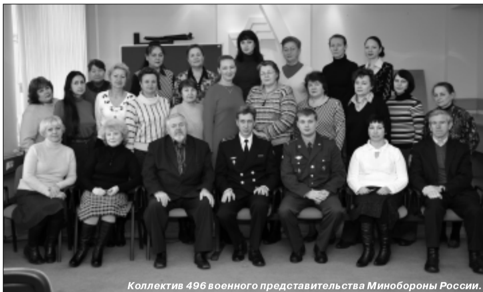
Коллектив 496 военного представительства Минобороны России.

вительство принимало более 90% от общего объёма продукции, производимой АПЗ и ОКБ «Импульс», а в 2009 году эта доля составляла около 80%.