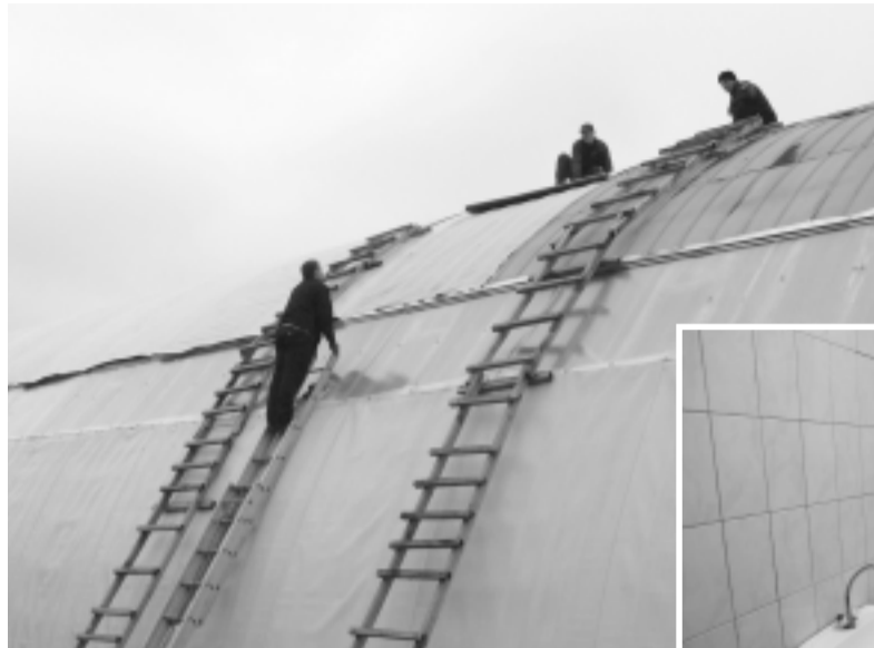
Меняется кровля на ангарах.

Модернизация и приобретение нового оборудования также способствовали созданию безопасных условий труда, снижению рисков