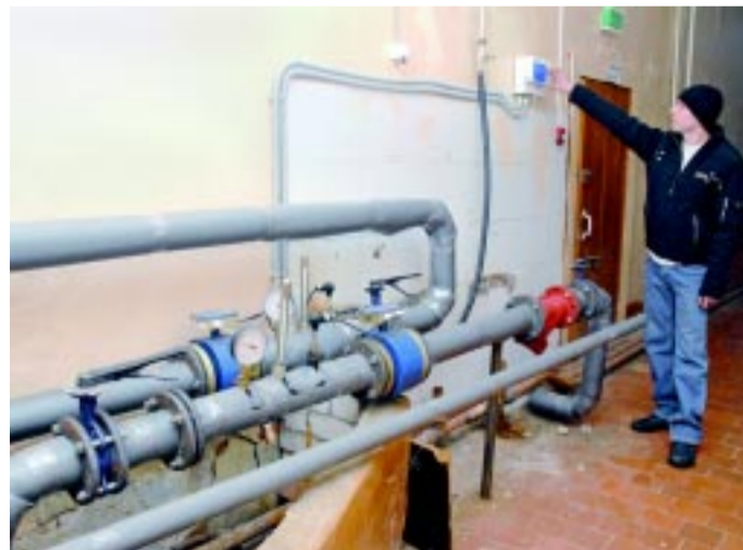
Теплосчётчик в школе №1.

больнице скорой медицинской помощи им. М.Ф. Владимирского.