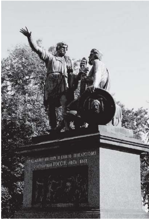
Памятник Минину и Пожарскому в Москве.

Молодежь воспринимает 4 ноября, как день отдыха. «Мы еще не прониклись духом единства. Вот гулять в этот