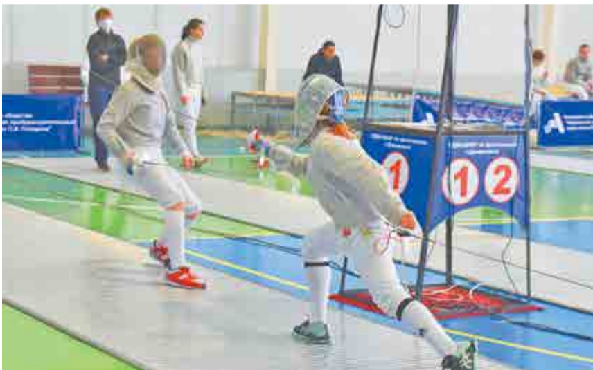
На дорожке сабlistки