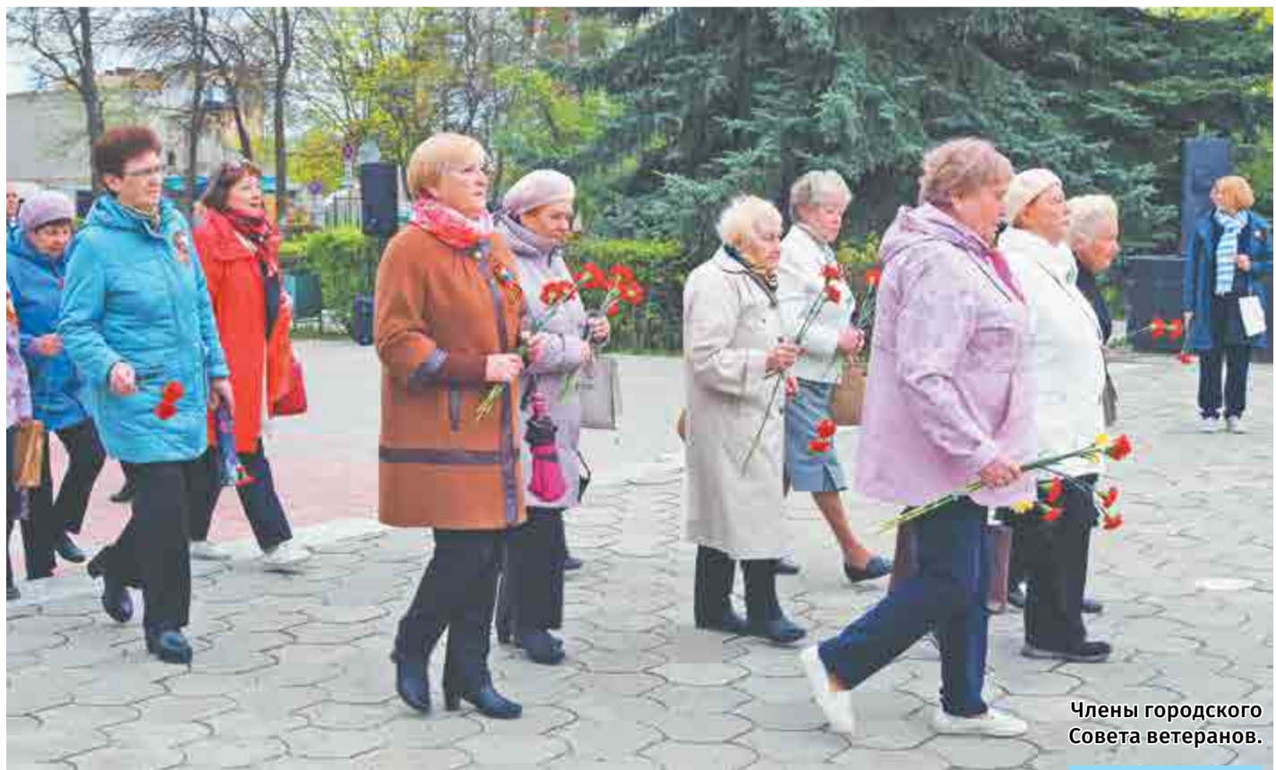
Члены городского Совета ветеранов.