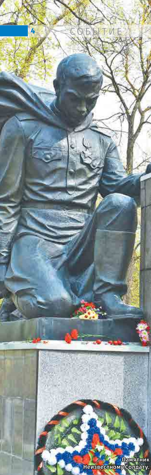
Памятник Неизвестному Солдату.