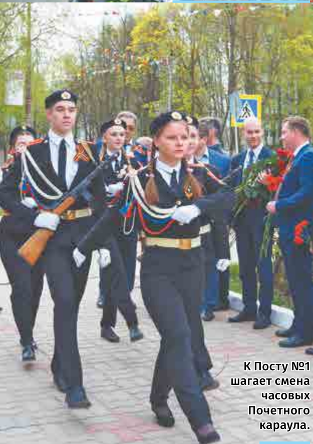
К Посту №1 шагает смена часовых Почетного караула.

В течение всего дня арзамасцы шли к Вечному огню –