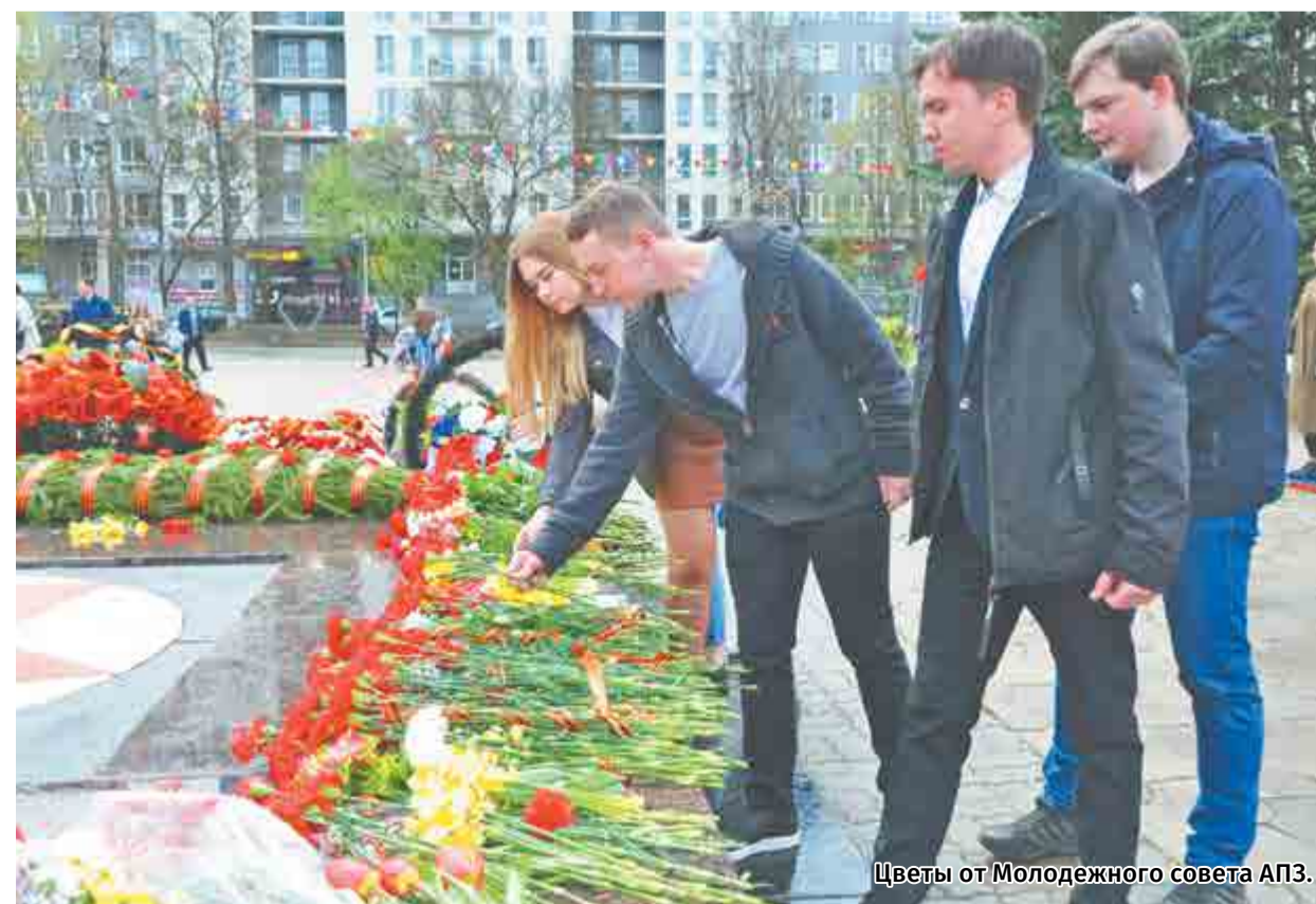
Цветы от Молодежного совета АПЗ.