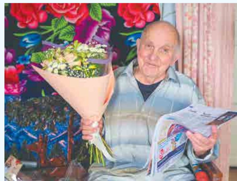
Серафим Сергеевич Макарычев.