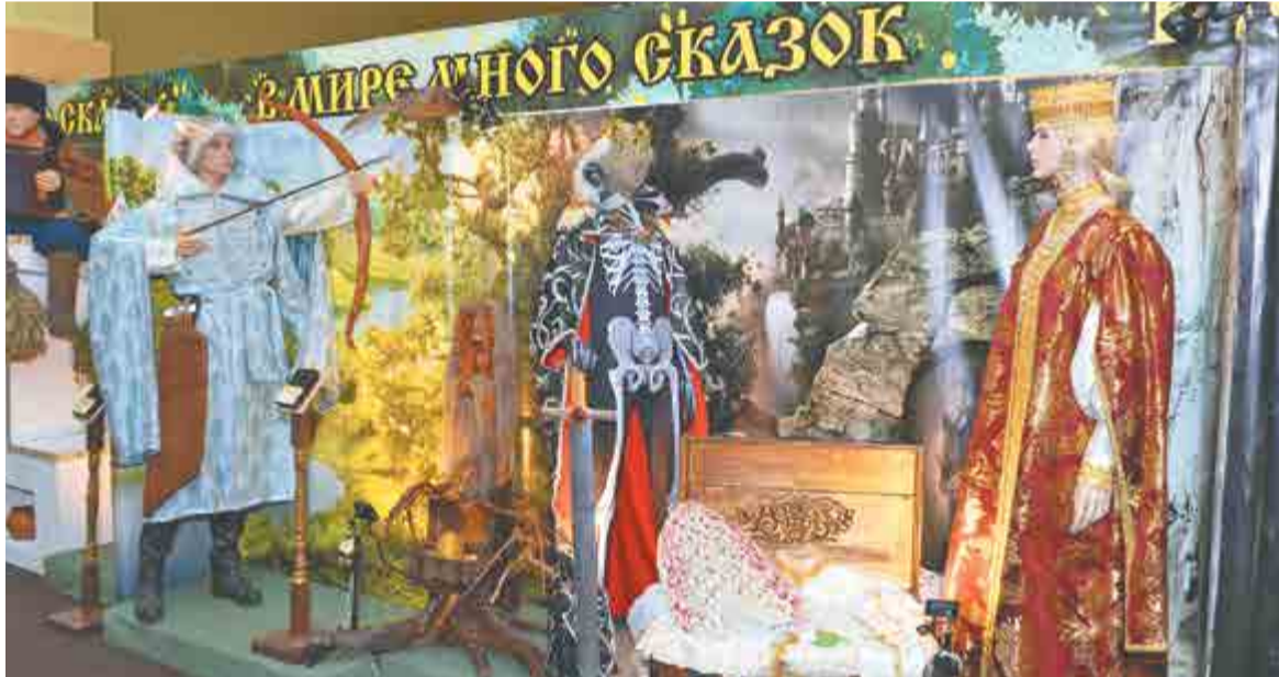
Всего на выставке представлено более 20 сказочных фигур.