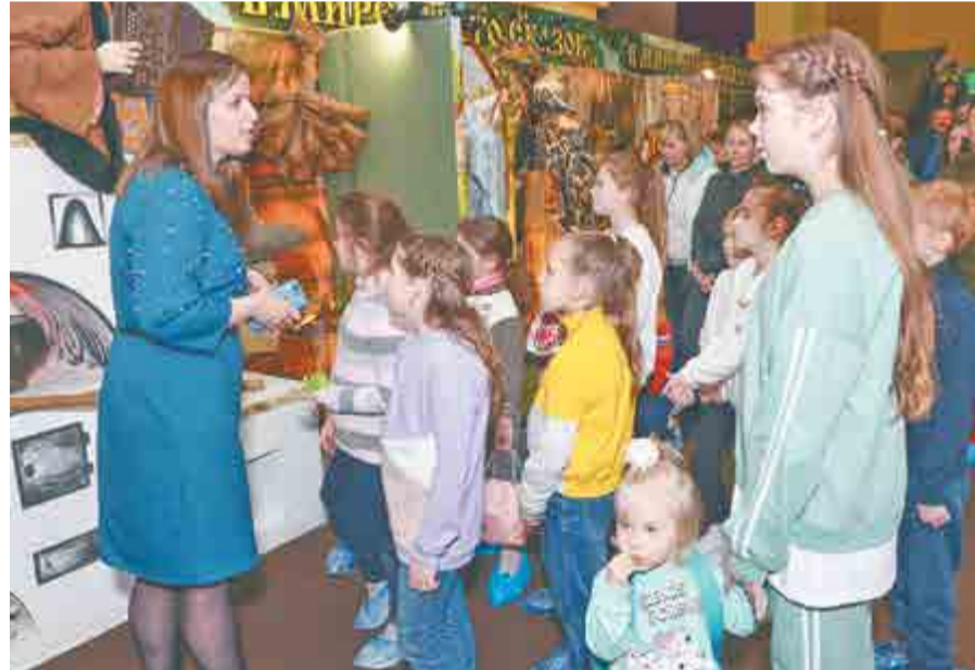
Рассказ экскурсовода ребята слушали с большим интересом.