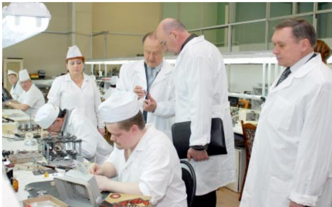
На сборке высокоточных деталей в цехе № 49.

– Руководством завода принята программа разработки и изготовления СВЧ-устройства космической связи и радиолокации (обнаружения и сопровождения) воздушных судов гражданской авиации,