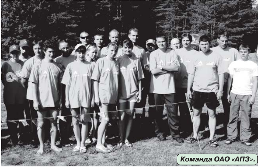
Команда ОАО «АПЗ».

ПРОЛИВНОЙ дождь, встретивший ребят, можно сказать, был первым их испытанием. Под его мерную «барабанную дробь» поставили палатки, собрали в лесу валежник, разожгли костёр. На славу получились и «стол» из подручного материала. Вокруг лагеря «очертили» «ленточную» границу, чтобы не зашли чужие. Из крепких брёвен соорудили ворота, а между ними водрузили флаг завода. Вскоре на каждой палаточной «улице» вкусно пахло походным обедом. Делились первыми впечатлениями от окружающего пейзажа: озера, берега, леса. Обжились, присматриваясь к местности, знакомились.