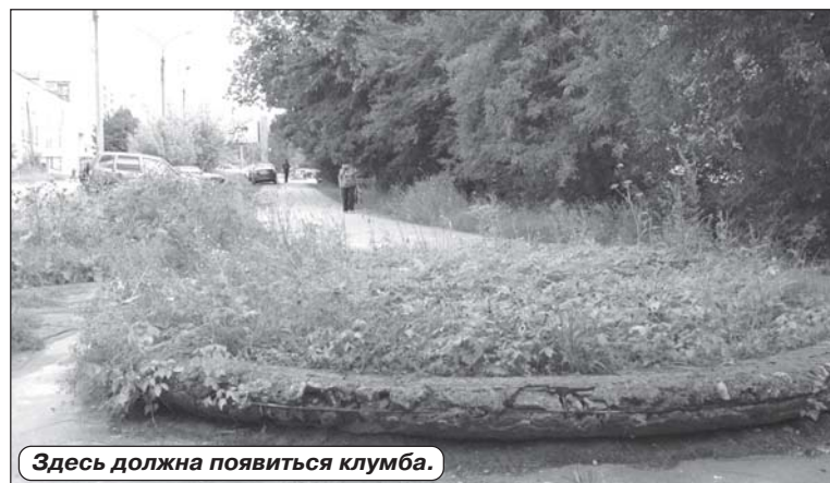
Здесь должна появиться клумба.

трассы, колдодцы и требующие обрезки деревьев. Было обращено внимание и на машины, стоящие на газоне. ОРИЭ пору-