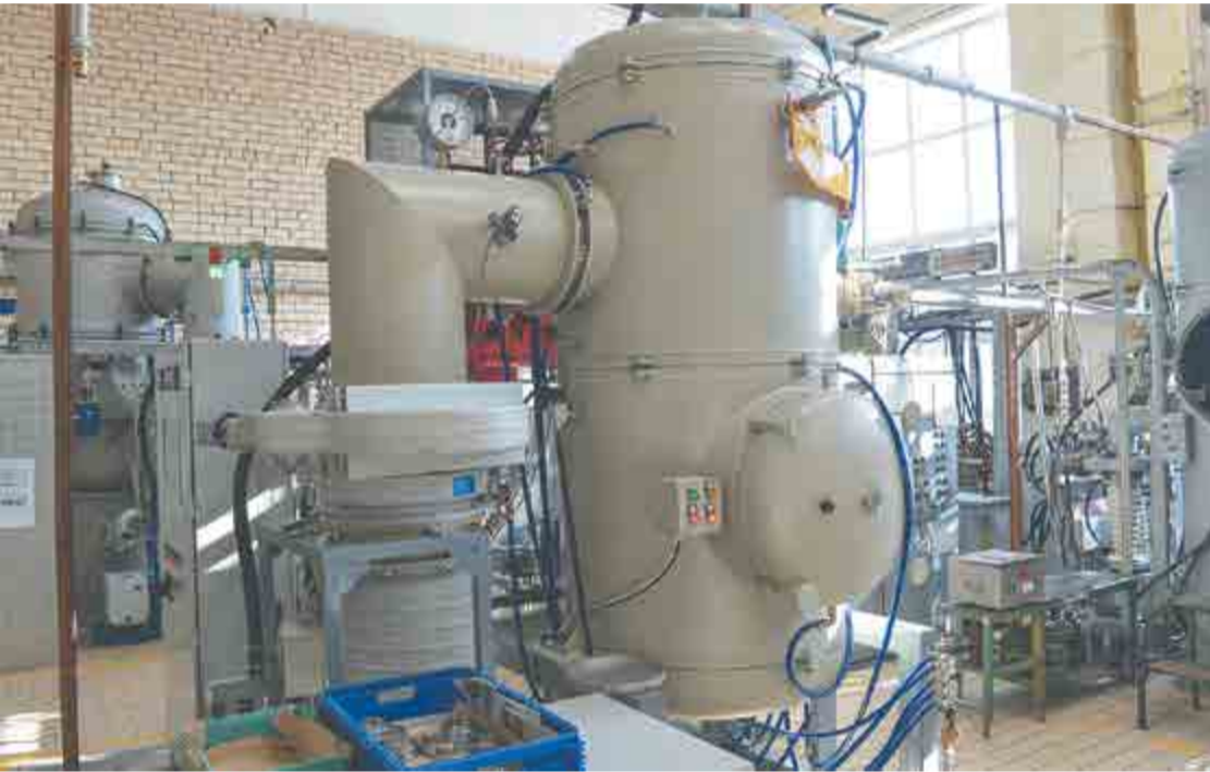
13 вакуумных печей работает на этом участке.

Оборудование работает на участке вакуумных печей литейного цеха №68.