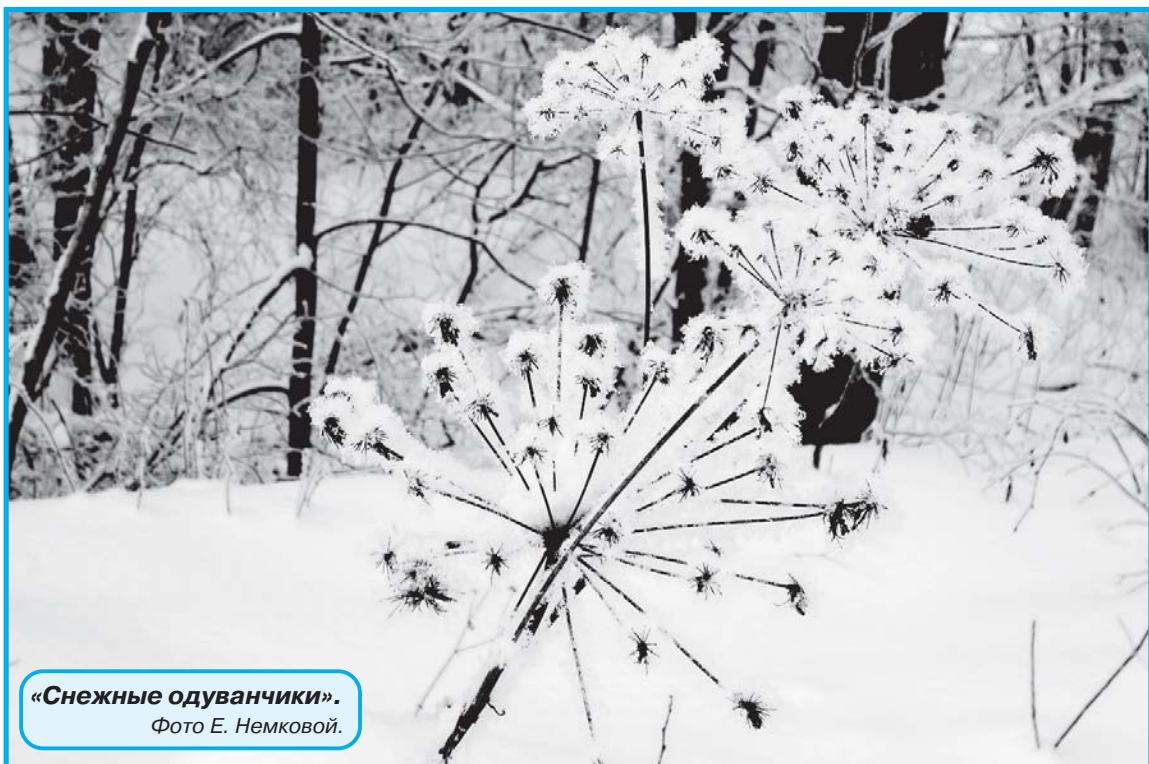
«Снежные одуванчики».