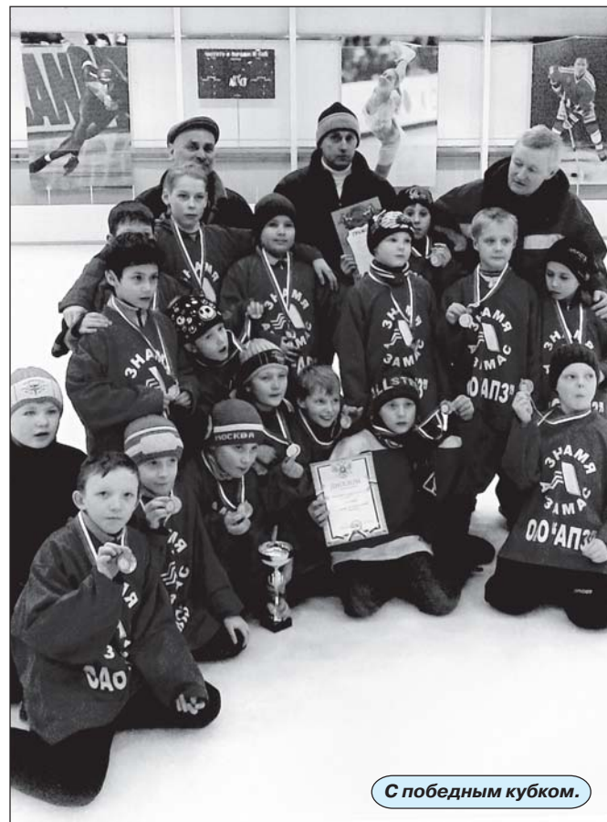
С победным кубком.

8 команд юга Нижегородской области боролись за выход в следующий этап игр на призы «Золотая шайба».