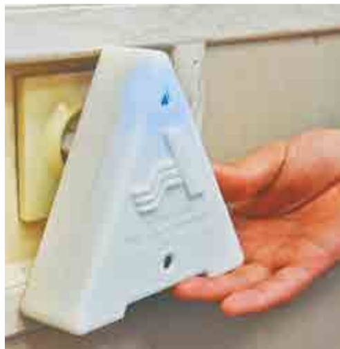
Корпус озонатора повторяет форму логотипа АПЗ.